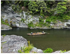
<長瀨ラインくだり>

岩畳とは、地下20~30kmで造られた岩が地表に現れ、荒川の清流によって浸食され今の姿になっています。地下深くの岩石を地表で観察できるので、「地球の窓」と呼ばれています。