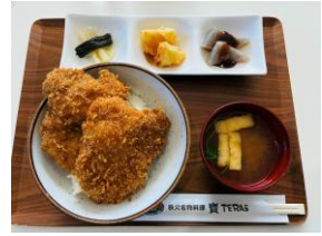
<秩父名物 わらじかつ丼>