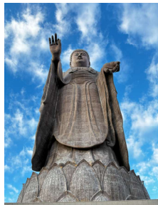
<下から望む大仏様>

大仏様を間近で見て、開口一番発した言葉が「でけえ」の一言。高崎の白衣大観音も大きいと思いましたがその高さは41.8m。いかに牛久大仏が大きいことが分かります。