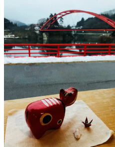
<宿から只見川を臨む>