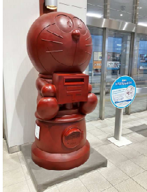
ドラえもんの郵便ポスト