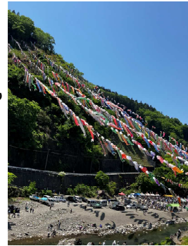
800匹の鯉のぼり これは匠巻