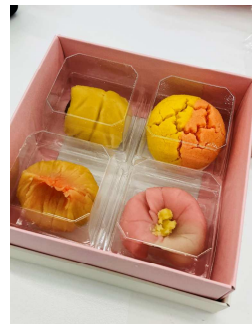
<和菓子体験 初作品>