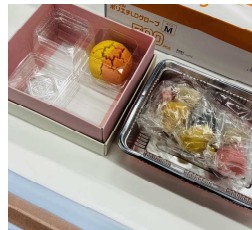
<お土産と練り菓子>